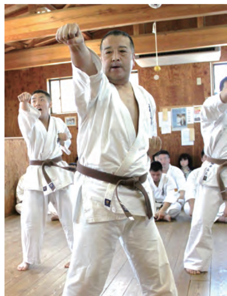
(昇段審査の時の写真。今は黒帯になっている。)